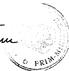
Călin POPESCU - TĂRICEANU